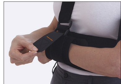
Handledsmanschetten kan öppnas separat vid träning.