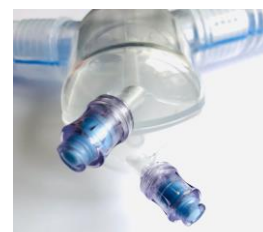
Dubbla Halkey-Roberts ventiler för att tömma vattenfällorna