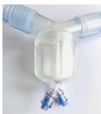
Finns med integrerad vattenfälla för både insp/exp.