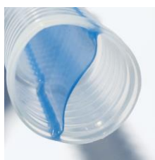
Delad innervägg (Septum)