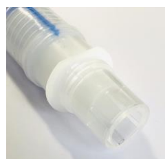
Finns med IGS (Integrerad Gas Sampling)