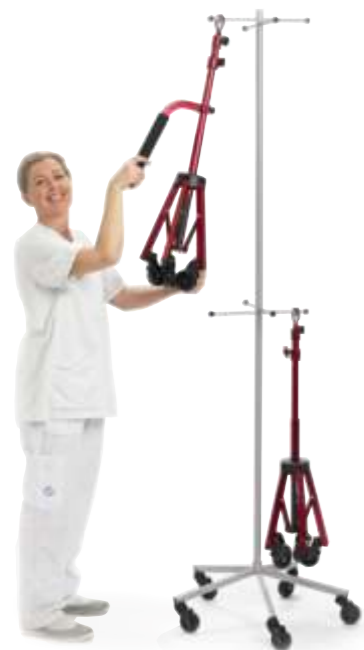
Praktisk att förvara