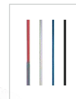
Exempel på färger

Höjd Lägst 88,5 cm (hopfälld). Högst 213 cm. Avser 3-delad modell.