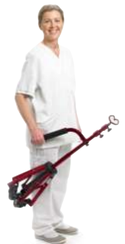
Lätt att bära