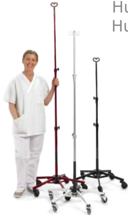
Stabil och funktionell

Hur förvarar man så många som 16 infusionsställ på en yta av 0.5 m 2 ? Hur transporterar och bär hemsjukvårdaren ett infusionsställ på ett effektivt sätt?