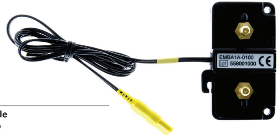
NOX RIP abdomen cable single pack to Embletta 7072196