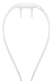
NOX cannula with luer-lock 7072096