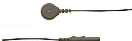
Snap on lead 7073446 (100 cm) 7073472 (150 cm)