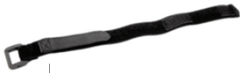
SPO2 3150 Wrist band 7073323