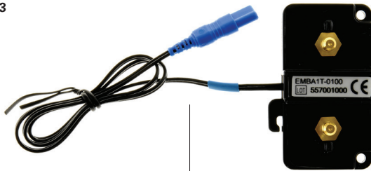
NOX RIP thorax cable single pack to Embletta 7072197