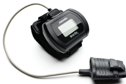
WristO 2 soft sensor 7072161 (S) 7072162 (M) 7072163 (L)