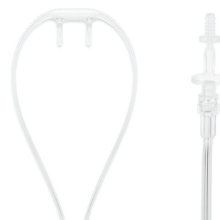
NOX Cannula with filter 7072074