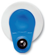
Blue sensor snap on electrode, 50 pk 7072171