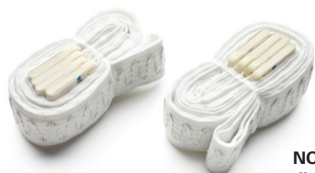
NOX RIP belts disposable 7072086 (Pediatric) 7072077 (S) 7072078 (M) 7072079 (L) 7073504 (XL)