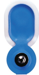
25 Snap on electrode - small size 7072583