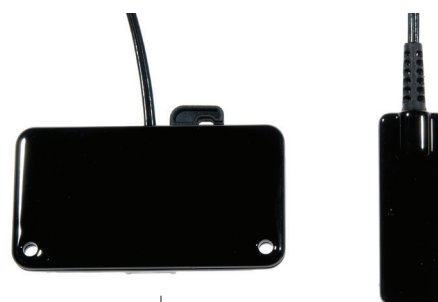
NOX abdomen cable 7072098