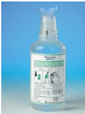
Ta bort den gröna skyddshuven som nu lossnat!