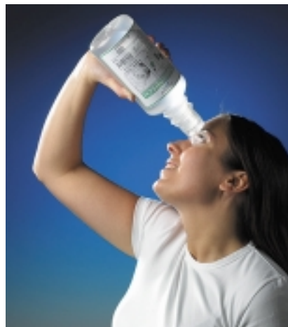
Öppna ögonlocken. Spola med huvudet bakåtlutat! Flaskan placeras så att spolkoppen hjälper till att hålla upp ögonlocken. Vätskan skall självrinna.