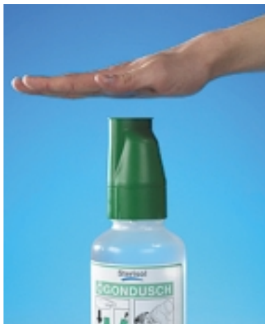
Slå hårt och bestämt med handen på den gröna skyddshuven!