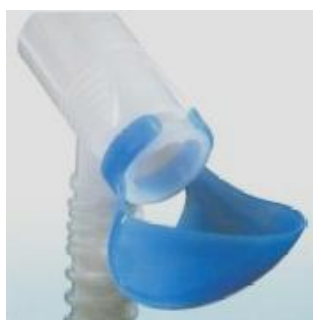
Tracheostomianslutning OPT 570