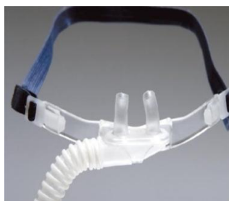
Optiflow OPT small Medium Large

RT 340 EVAQUA är världens första slangset som utvecklats för att eliminera kondens i utandningsslangen med användning av genomsläpplig membranteknik