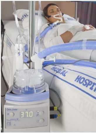
Slangset RT 203