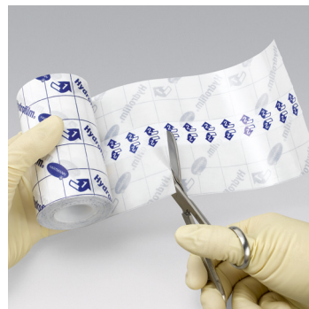
Klipp för önskad längd.

Produkten är klassificerad som medicinteknisk produkt, klass I, osteril. CE-märkt enligt EU-direktiv 93/42/EEC.