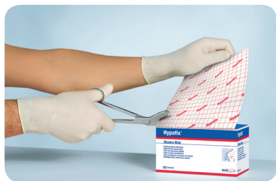
1. Klipp av lämplig längd