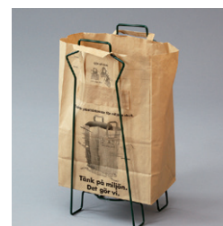
Matavfallsbärkasse 22 lit