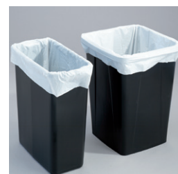
Insatssäck för sorteringsbehållare