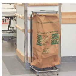
Sopsäck 60 lit