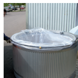
Insatssäck för djupbehållare