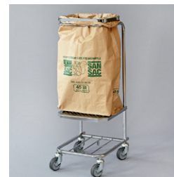
Matavfallssäck 45 lit