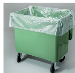
Insatssäck för kärl