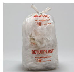
Källsorteringssäckar med knythandtag