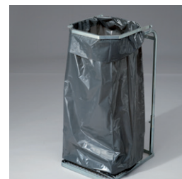
Säckar av återvunnen polyeten