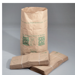
Sopsäck 160 lit