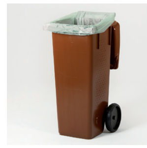
Insatssäck för kärl