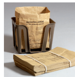
Matavfallspåse 9 lit