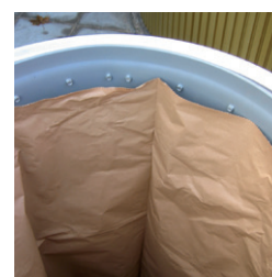
Insatssäck djupbehållare 800 lit