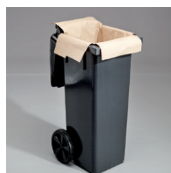
Insatssäck 140 lit