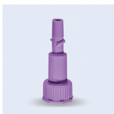
Freka ENFit ENLock stegadapter

ENFit (female) och LL (male). Passar till LL-aggregat och ENFit-sonder. Fri från PVC och latex. Ej steril- eller styckförpackad.