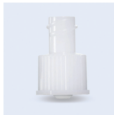
Freka adapter ENFit-LuerLock

Kopplar samman enterala aggregat med ENPlus koppling med EasyBottle flaskor (näringsdryck) för att kunna ge sonder-närning. ENPlus koppling. Fri från latex och bisfenol A. Sterilförpackad (EO).