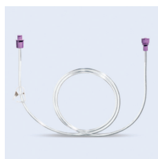
Freka förlängningsslang 100 cm ENFit

Kan kopplas till ENFit sprutor och female koppling på aggregat. Fri från PVC och latex. Ej steril- eller styckförpackad.