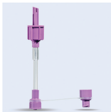
EasyBag Bolusadapter ENFit

Adapter för ENFit sprutor för uttagande av bolusvolym från sondnärningar i EasyBag. Säker enteral ENFit koppling, enligt den internationella säkerhetsstandarden ISO 80369-3. För en säker och tätslutande anslutning. Slang i PVC med mjukgörare TEHTM. Fri från latex och bisfenol A. Sterilförpackad (EO).