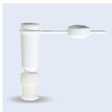
Freka universaladapter ENFit

Adapter till konformade sonder. Kopplas till sprutor, aggregat eller förlängningsslangar. Säker enteral ENFit koppling, enligt den internationella säkerhetsstandarden ISO 80369-3. För en säker och tätslutande anslutning. Slang i PVC med mjukgörare TEHTM. Fri från latex och bisfenol A. Sterilförpackad (EO).