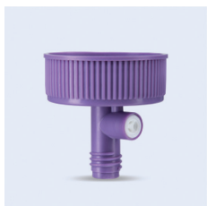
VarioLine adapter ENPlus

Konformad adapter som passar till exempelvis konformade sprutor. ENFit kopplingen (female) passar till ENFit (male) så som sonder, läkemedelsportar på ENFit aggregat. Säker enteral ENFit koppling, enligt den internationella säkerhetsstandarden ISO 80369-3. För en säker och tätslutande anslutning. Fri från PVC, latex och bisfenol A. Sterilförpackad (EO).