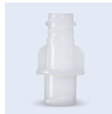
Freka adapter Female LuerLock ENFit

ENFit (male) och LL (female). Passar till sonder med LL (male). Fri från PVC och latex. Ej steril- eller styckförpackad.