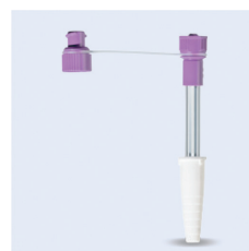
Freka konadapter ENFit

Passar till aggregat med ENFit-koppling. Fast ENFit-koppling, både male/female. Slangklämma. Fri från latex, PVC och bisfenol A. Sterilförpackad (EO).