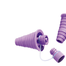
VarioBottle Adapter ENFit

Används tillsammans med enterala aggregat med ENPlus koppling och flaskor med bred hals så som nappflaskor. ENPlus koppling. Fri från latex och bisfenol A. Sterilförpackad (EO).