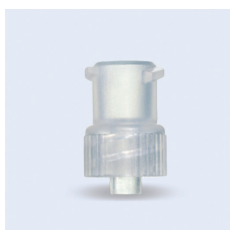
Freka adapter LuerLock-ENFit

Adapter för port ENFit (female) - LL (female) oral. Fri från PVC och latex. Ej steril- eller styckförpackad.