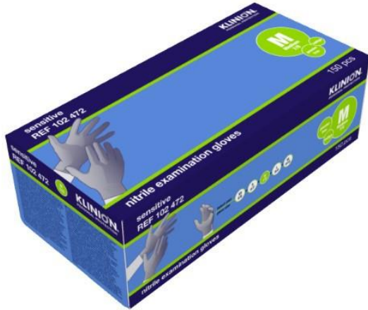
Ref. product 102472