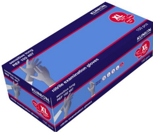
Ref. product 102487