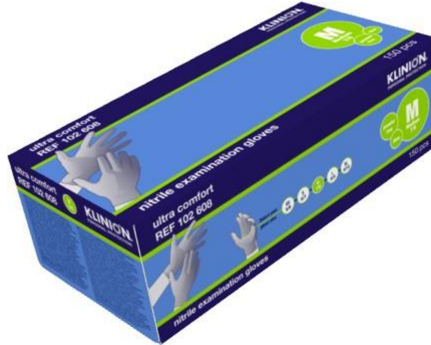
Ref. product 102605