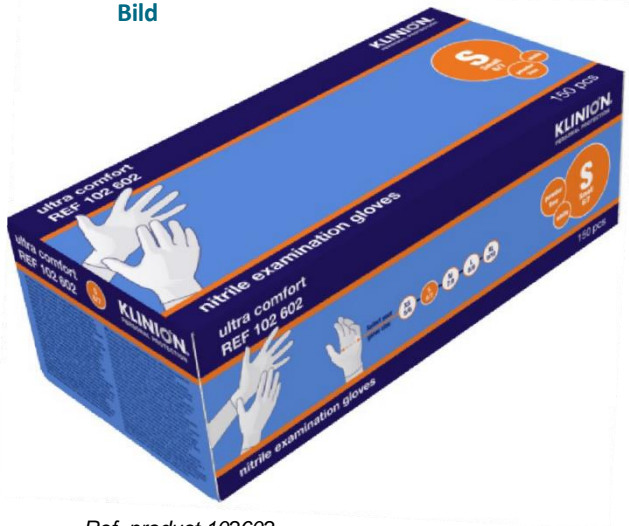
Ref. product 102602