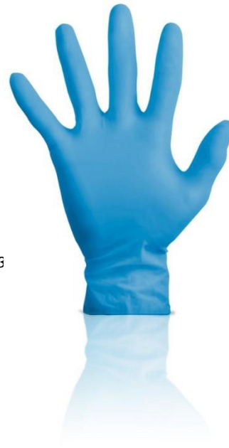
Ref. product 165043