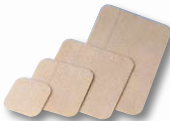
DuoDERM® E förband