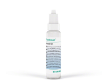
Prontosan® sår Gel