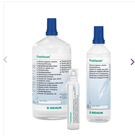
Prontosan® Wound irrigation sol. group